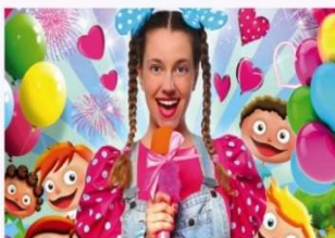
16h00 NINA TOCTOC 17h30 - Aniversário da Rádio Cidade de Tomar 21h30 - Omni

20 Segunda (Dia de Santa Iria) Out 9h30 - Missa na Igreja Santa Maria dos Olivais 10h30 - Procissão (R. Aquiles da Mota Lima, Praceta Mário Nunes, R. Manuel de Matos, Praceta Raul Lopes, Alameda Um de Março, R. Marquês de Pombal, Ponte Velha, Capela Santa Iria) 21h30 - Noite de Fados