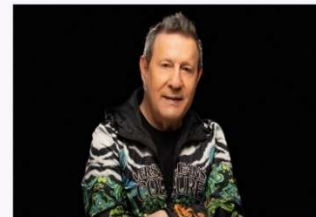
17h30 JOSÉ MALHOA 19h00 - Aula de Zumba