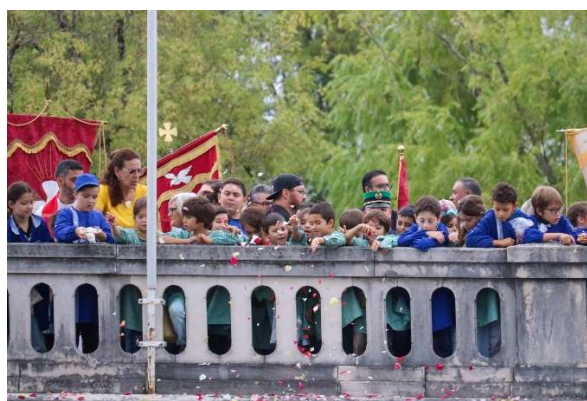
Tomar, 06 de janeiro de 2026