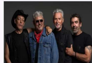
22h50 XUTOS & PONTAPÉS