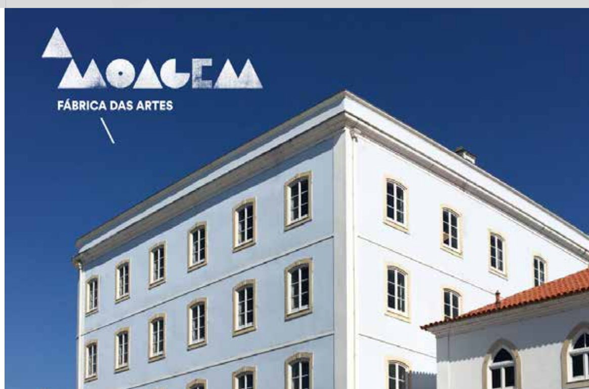
Complexo Cultural da Levada - Moagem A Portuguesa