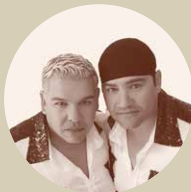
21 Out. 22h30 NÉMANUS