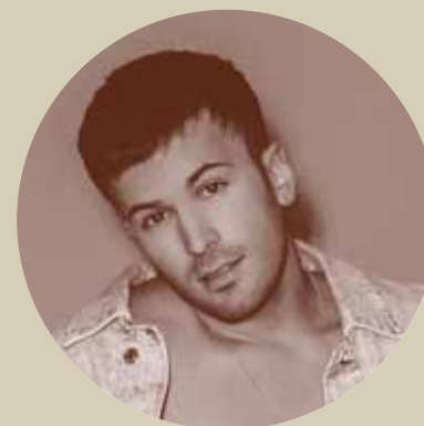
22 Out. 22h30 DAVID CARREIRA