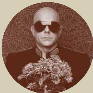
15 Out. 22h30 PEDRO ABRUNHOSA