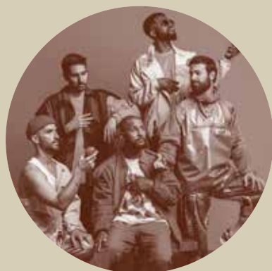
14 Out. 22h30 HMB