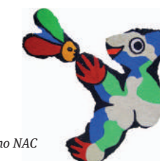
Obra de José de Guimarães no NAC

11 Caso tenha tempo, dê um pulinho ao Núcleo de Arte Contemporânea (NAC) (11). E, se ainda não teve oportunidade, aproveite para provar a gastronomia local.